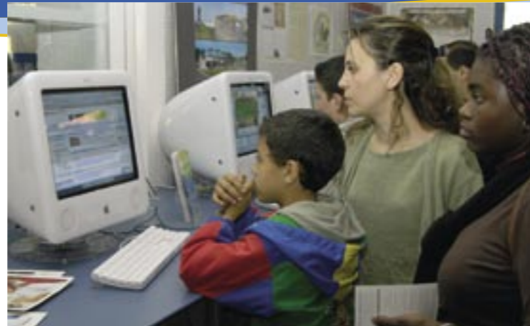
Internet pour tous : les initiatives de la Ville ont été récompensées.

Cette récompense, la plus haute obtenue en Aquitaine et même dans le grand sud-ouest (ex æquo avec Bordeaux et Mérignac) souligne le dynamisme de la Ville de Lormont dans la promotion et la mise en œuvre d'un internet citoyen accessible à tous.