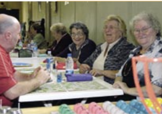
Pendant les travaux, les usagers de la salle Colmet pourront poursuivre leurs activités à l'Espace Castelldefels et au Centre social et culturel Gécicart.