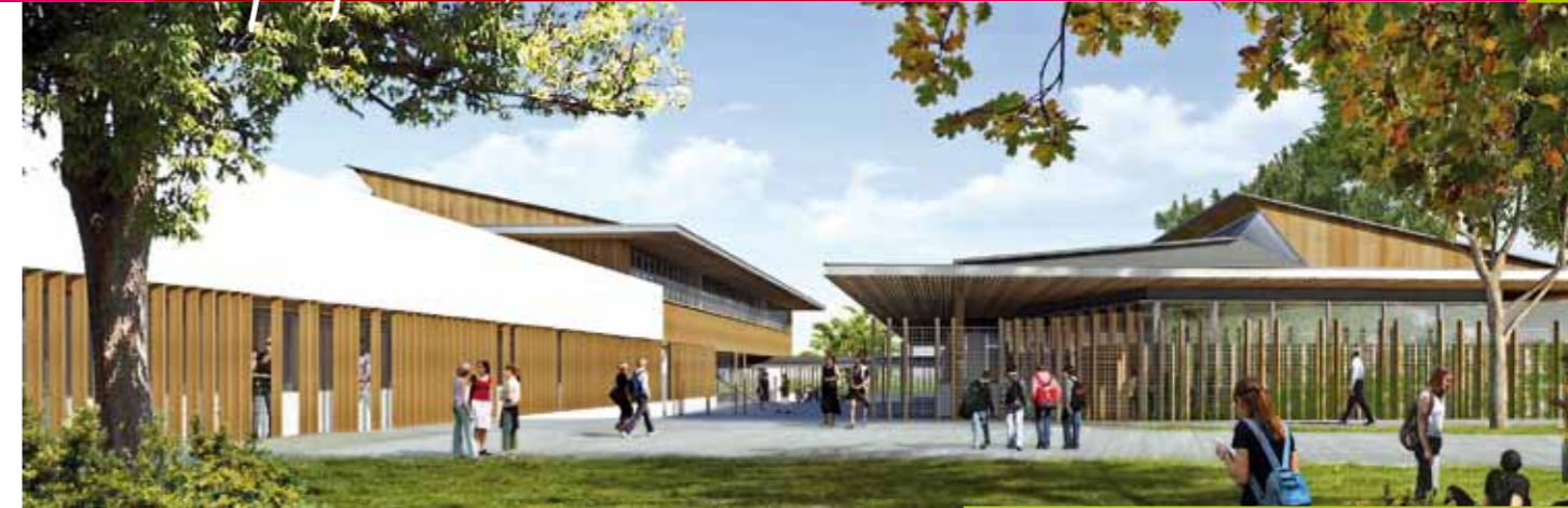
Le collège, ouvert sur le parc environnant...