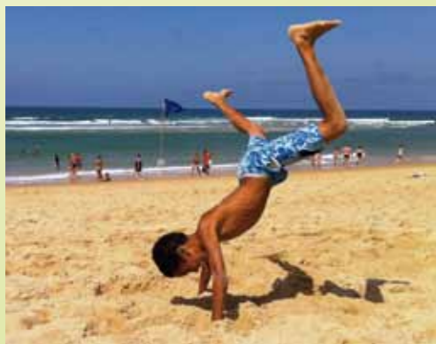
Modulo vacances a rythmé l'été des 11 / 17 ans. Rendez-vous sportifs, culturels, ludiques et baignades se sont succédés tout l'été.