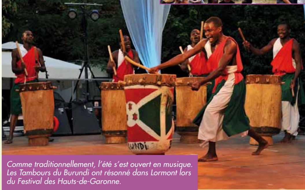
Comme traditionnellement, l'été s'est ouvert en musique. Les Tambours du Burundi ont résonné dans Lormont lors du Festival des Hauts-de-Garonne.