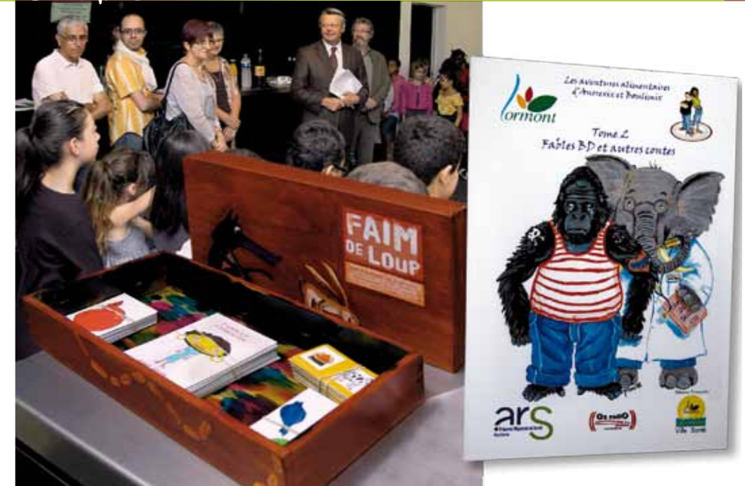
Des écoliers bien sensibilisés aux dangers des déséquilibres et excès alimentaires.