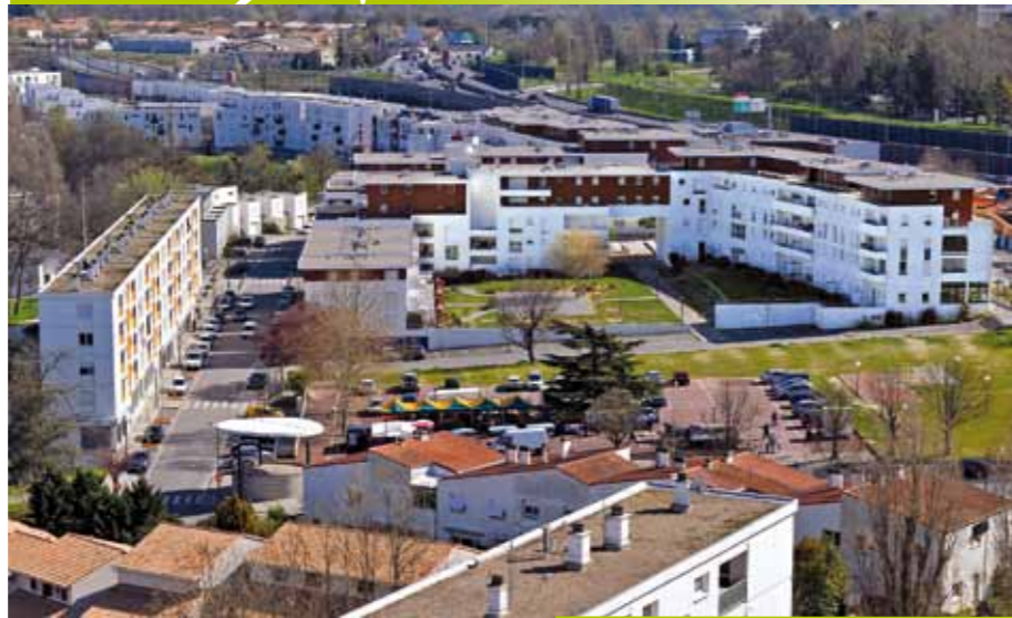
Carriet, une métamorphose primée