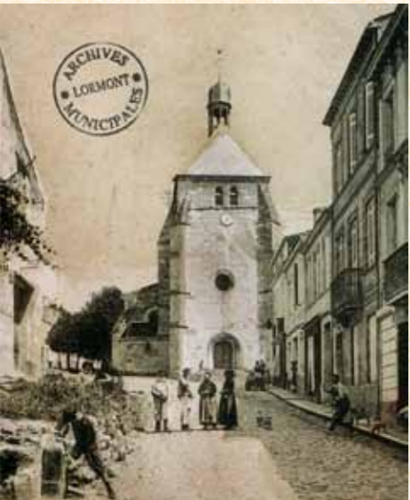
L'église Saint-Martin telle qu'il y a seulement un siècle...