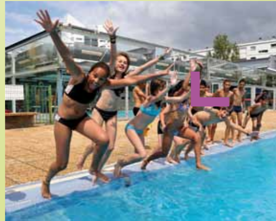
Après deux mois de travaux, Lormont a retrouvé sa piscine municipale. Bassins intérieur et extérieur – et bien sûr plongeurs – ont fait la joie de baigneurs venus entre ami(e)s ou en famille.