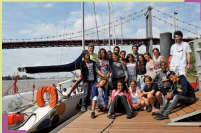
Grands sourires de nos jeunes navigateurs, lors de leur retour d'un raid voile de six jours à la découverte de l'estuaire.