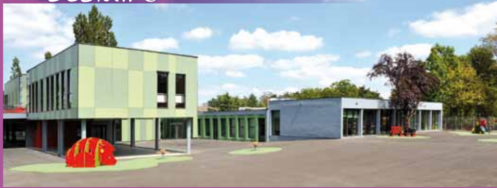
Une école maternelle toute neuve attend les petits écoliers de Jean Rostand