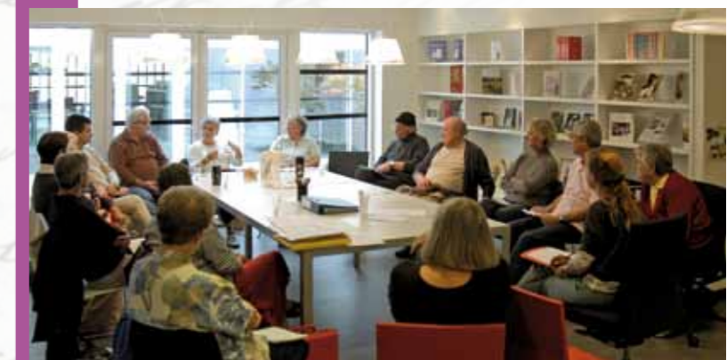
Deux fois par mois, des passionnés de généalogie se réunissent au Bois fleuri

Contact : 05 56 74 59 83 / archives@ville-lormont.fr