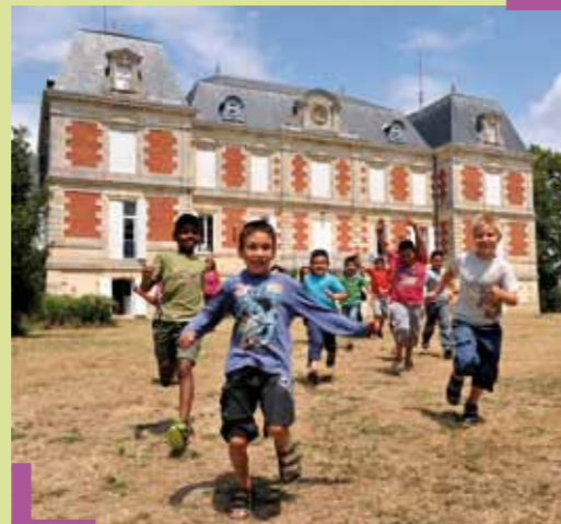
Comme chaque été, le château et le parc des Iris ont offert un somptueux terrain de jeux aux enfants, puisque c'est là qu'est organisé le centre de loisirs des 5-14 ans. Les plus jeunes, installés à Lescalle, ont bénéficié de la prairie et de la pataugeoire qui font le charme de ce site.