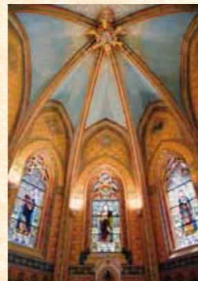
L'église Saint-Martin aujourd'hui rénovée

Contact : Association les Amis du vieux Lormont (05 56 06 35 60) ou Office de tourisme de Lormont et de la Presqu'île (05 56 74 29 17)