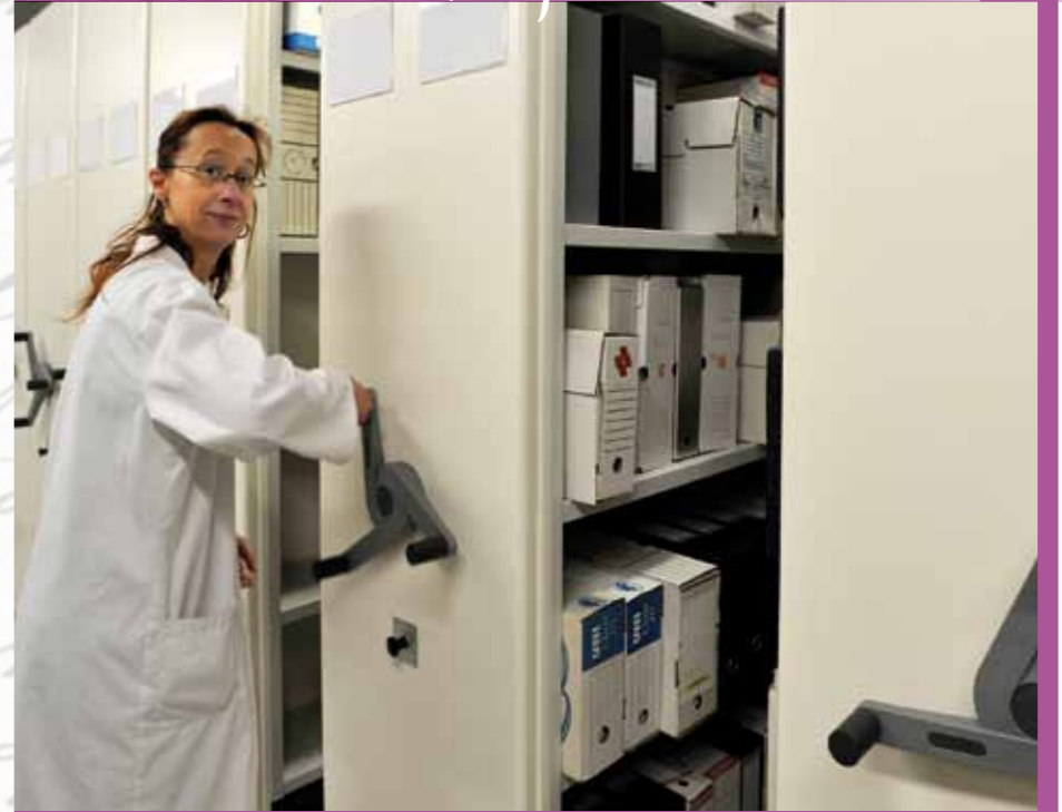
800 mètres linéaires de documents sont conservés aux Archives municipales