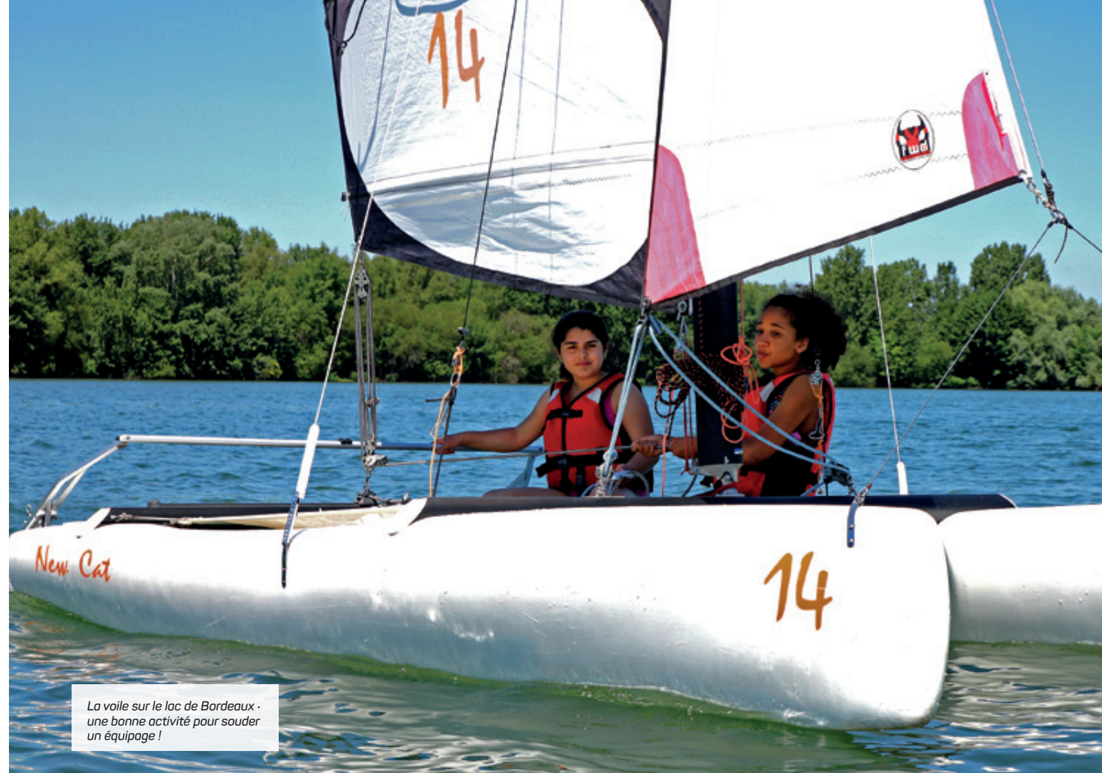
La voile sur le lac de Bordeaux : une bonne activité pour souder un équipage !