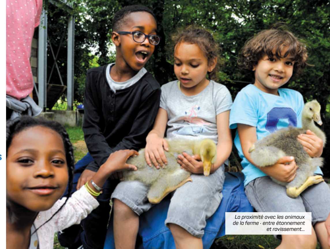
La proximité avec les animaux de la ferme - entre étonnement et ravissement...

+ D'INFOS Tel : 05 56 33 83 95 cgcvi@wanadoo.fr