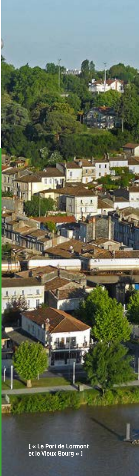
[ « Le Port de Lormont et le Vieux Bourg » ]