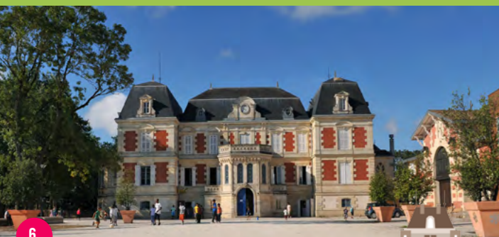
6. CHÂTEAU ET PARC DES IRIS

Emblématique sur la rive droite, la ferme urbaine des Iris est accessible librement tous les jours de 8h à 20h. Cet espace de cinq hectares verdoyant aux allures d'Arche de Noé accueille ânes, poneys, moutons, brebis, poules, lapins, chèvres, truies ou encore pintades. Des tables et bancs y sont installés pour profiter de cette nature préservée.