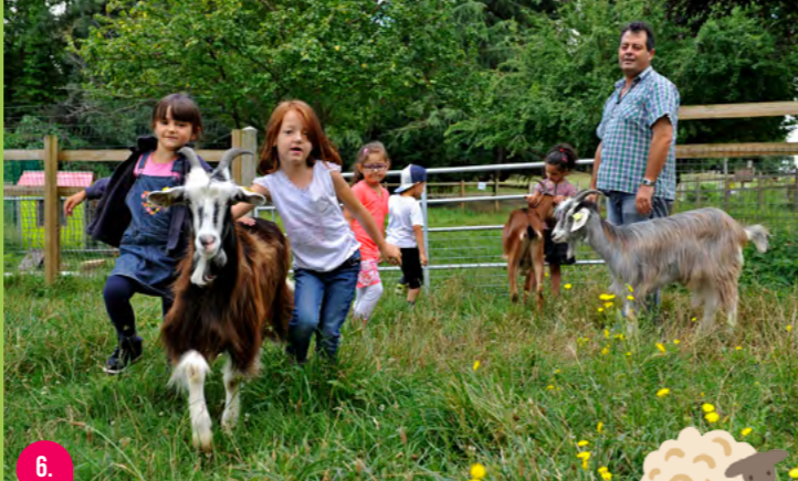
6. FERME DES IRIS

Le lac de l'Ermitage est un écosystème riche abritant cistudes, grenouilles, hérons cendrés, grèbes ou encore aigrettes. Ce patrimoine a été reconnu comme zone d'intérêt écologique faunistique et floristique (ZNIEFF) en 1982. On y trouve également le Nuage, refuge périurbain, délicatement posé sur la berge ouest (à réserver de mai à octobre). Pour la sécurité des visiteurs et la préservation des espèces sauvages, la baignade est interdite.