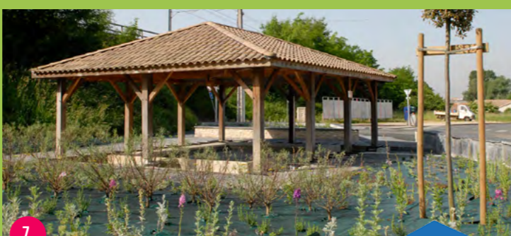
7. LAVOIR DE LISSANDRE