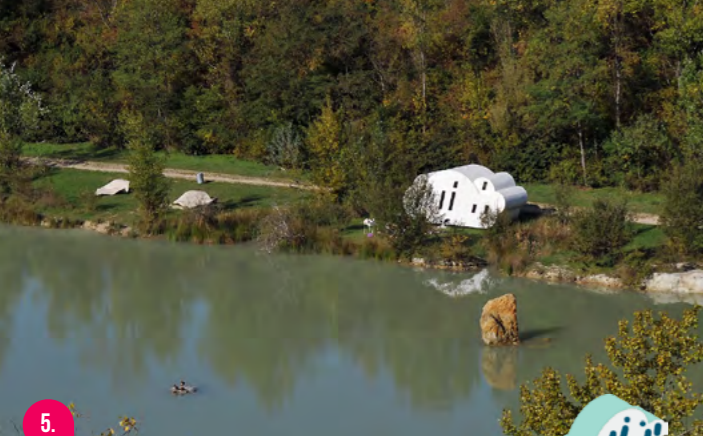
5. LAG DE L'ERMITAGE

Le lac de l'Ermitage est un écosystème riche abritant cistudes, grenouilles, hérons cendrés, grèbes ou encore aigrettes. Ce patrimoine a été reconnu comme zone d'intérêt écologique faunistique et floristique (ZNIEFF) en 1982. On y trouve également le Nuage, refuge périurbain, délicatement posé sur la berge ouest (à réserver de mai à octobre). Pour la sécurité des visiteurs et la préservation des espèces sauvages, la baignade est interdite.